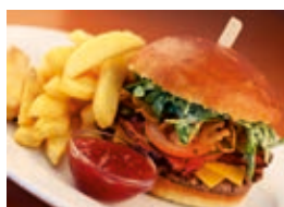
Na jídelním lístku: Caesar Burger s hranolky.

BŘECLAV. Čerstvé steaky přímo od řezníka na talíř. Nejrozmanitější variace oblíbeného pokrmu nyní připravuje nový šéfkuchař restaurace Celnice. Dobrý steak je výsledkem procesu dlouhého zrání, které začíná u zodpovědného chovatele