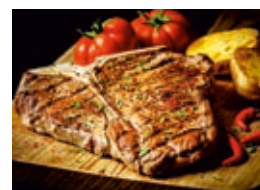
Oblíbená klasika: T-Bone steak (nízký roštěnec).

prezentuje se 200 místy a je vybevena klimatizovanými salůnky různých velikostí, které jsou vhodné zejména pro obchodní jednání, svatby, porady, soukromé oslavy, smuteční slavnosti nebo různé akce až pro 50 osob. Celá restaurace je nekuřácká. Kouření je povoleno na přilehlé terase, která je vyhřívána.